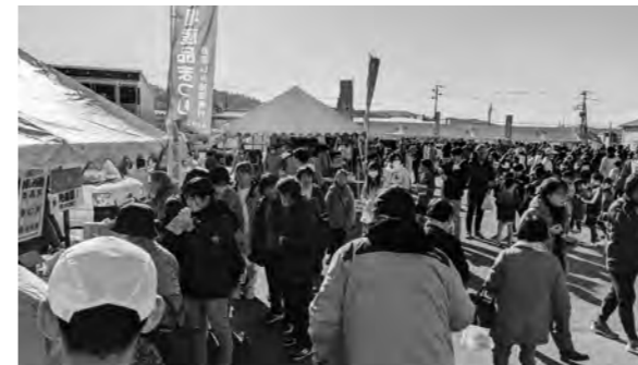
地場産品まつり 抽選会会場

また、会場内では青年部登米支部が「足湯」や「お菓子つかみ取り」を、女性部登米支部は「みそ汁無料サービス」に協力し、多くの来場者で賑わいました。