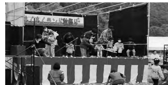
ちびっこ釣り大会

10月19日（日）、つやま道の駅農村公園内で「2025もくもくランド秋祭り」が開催されました。会場では多くの地場産品等の出店テントが連なり、ステージでは、津山創作太鼓、火伏の獅子舞やちびっこ釣り大会、場内イベントでは縁日コーナー、木工体験コーナー等が催され、親子連れでイベントを楽しむ姿もみられました。郷土料理「はっと鍋」や「新米おにぎり」の振る舞いには、長蛇の列が連なり、クライマックスである「餅まき」と「抽選会」では賑わいが頂点に達し、大人も子供も多いに楽しむ姿がみられました。