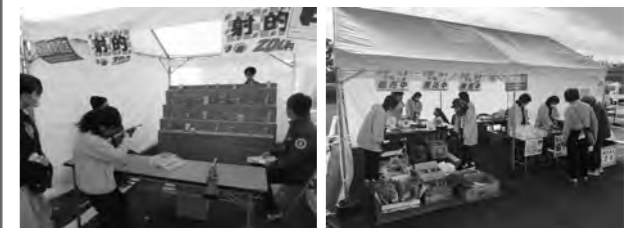
青年部「お楽しみコーナー」 女性部「売店コーナー」

11月2日（日）、登米市役所中田庁舎前駐車場で「第37回なかだの秋まつり」が開催されました。会場では、登米総合産業高校や上沼観光りんご生産組合が旬の農産物を販売するほか、商工会物産展では地元事業者が出店し、各店舗が腕を振るった自慢のメニュー等を提供。商工会では抽選会を実施し多くの方にご参加いただきました。また、地域振興活動として商工会青年部・女性部も出店し来場者をもてなしました。特設ステージでは民俗芸能や地元中高生の吹奏楽部等が演奏を披露し、会場を大いに盛り上げました。