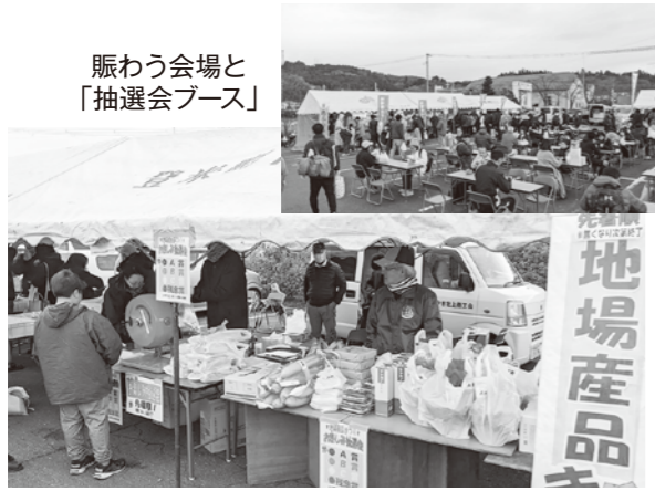
賑わう会場と「抽選会ブース」

12月3日(日)、4年ぶりに開催された第35回カップハーフマラソンの協賛企画として、地場産品まつりを実施しました。会場の登米総合体育館(蔵ジウム) 駐車場には特産品や飲食物販売など14店が出店し、出場選手と来場者を歓迎しました。地場産品等が当たるお楽しみ抽選会では、目当ての賞品を引き当てようと、期待を込めて抽選機を回し、大人も子供も楽しむ姿が見られました。