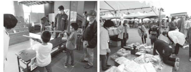
青年部「射的コーナー」 女性部「バザーブース」

登米総合産業高等学校の農作物販売や牛肉無料試食コーナーには来場者が列をなして産品を求める様子も見られ、4年ぶりの開催となりましたが、中田町の「秋」を感じられるイベントとなりました。